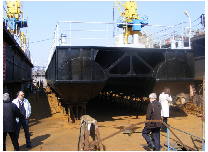
2. Inspecție Autoritatea Navală Română a pontoanelor