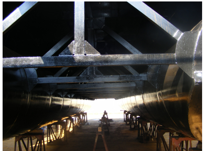
4. Structură ponton