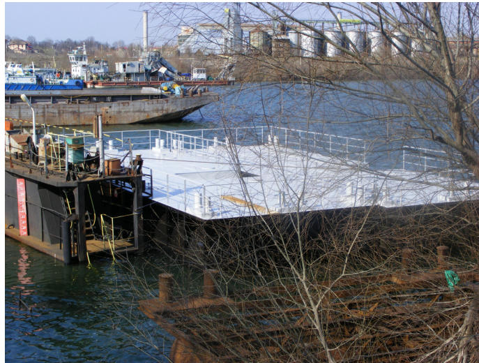
7. Pontoane lansate la apă