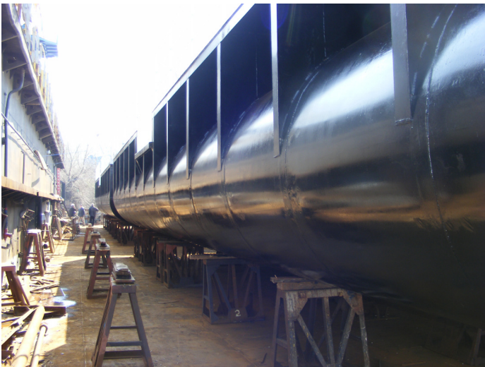
3. Corp ponton