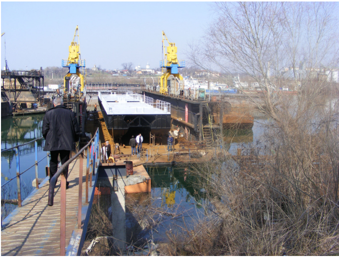
1. Pontoane pe docul plutitor

în cadrul proiectului “Sistem de preluare și prelucrare reziduuri de la nave și intervenție în caz de poluare pe sectorul Dunării administrat de CN APDF SA Giurgiu”, proiect cofinanțat de Comisia Europeană din Fondul European de Dezvoltare Regională prin Programul Operațional Sectorial Transport 2007 – 2013