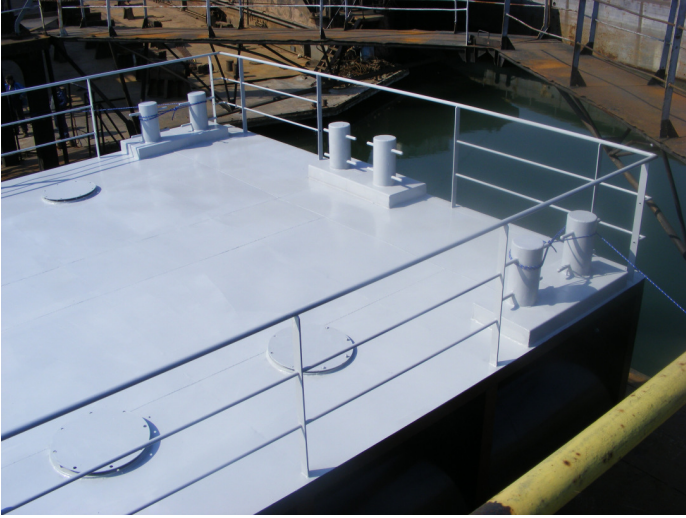
5. Platformă ponton